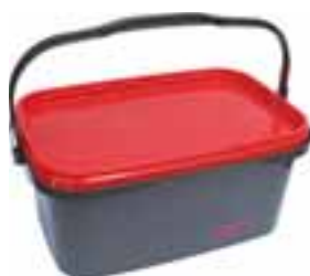
V praktickém plastovém boxu