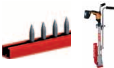
EJOFAST® utahovačka JF také k zapůjčení