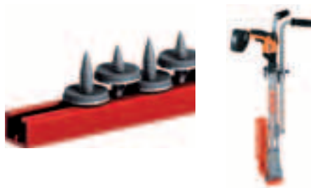
EJOFAST® utahovačka JF také k zapůjčení