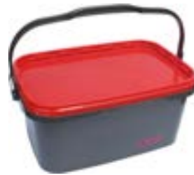
Im praktischen Kunststoffbehälter