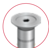
SUPERPLUS SKLS A4