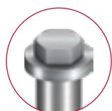
SUPERPLUS SLS A4