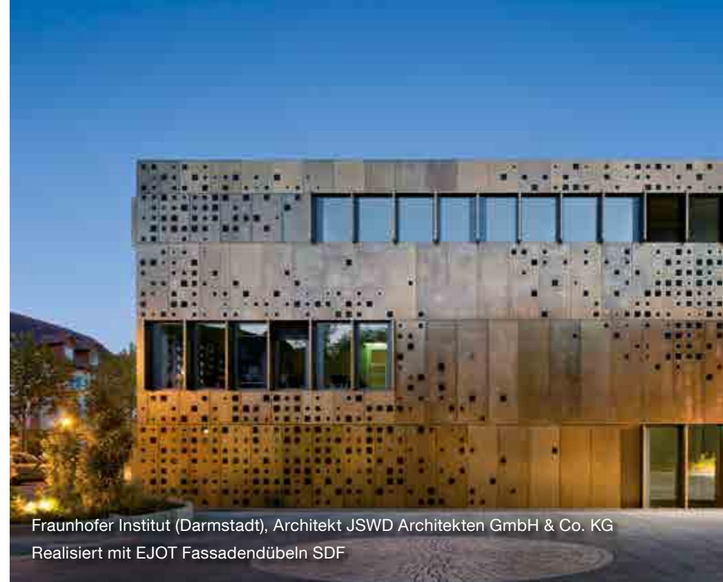
Fraunhofer Institut (Darmstadt), Architekt JSWD Architekten GmbH & Co. KG Realisiert mit EJOT Fassadendübeln SDF

So unterstützen wir Sie dabei, Ihr Projekt zu genau dem zu machen, was Sie sich vorstellen – eine einzigartige Form- und Designsprache gepaart mit dem Charakter eines zeitlosen architektonischen Meisterwerkes. Bohr- und gewindefurchende Schrauben, Kunststoffdübel, mechanische und chemische Schwerlastanker sowie Befestigungselemente für Flachdächer und Solaranwendungen und darüber hinaus Befestigungslösungen für Wärmedämmverbundsysteme: Auf die Qualität und die Kompetenz von EJOT können Sie stets bauen.