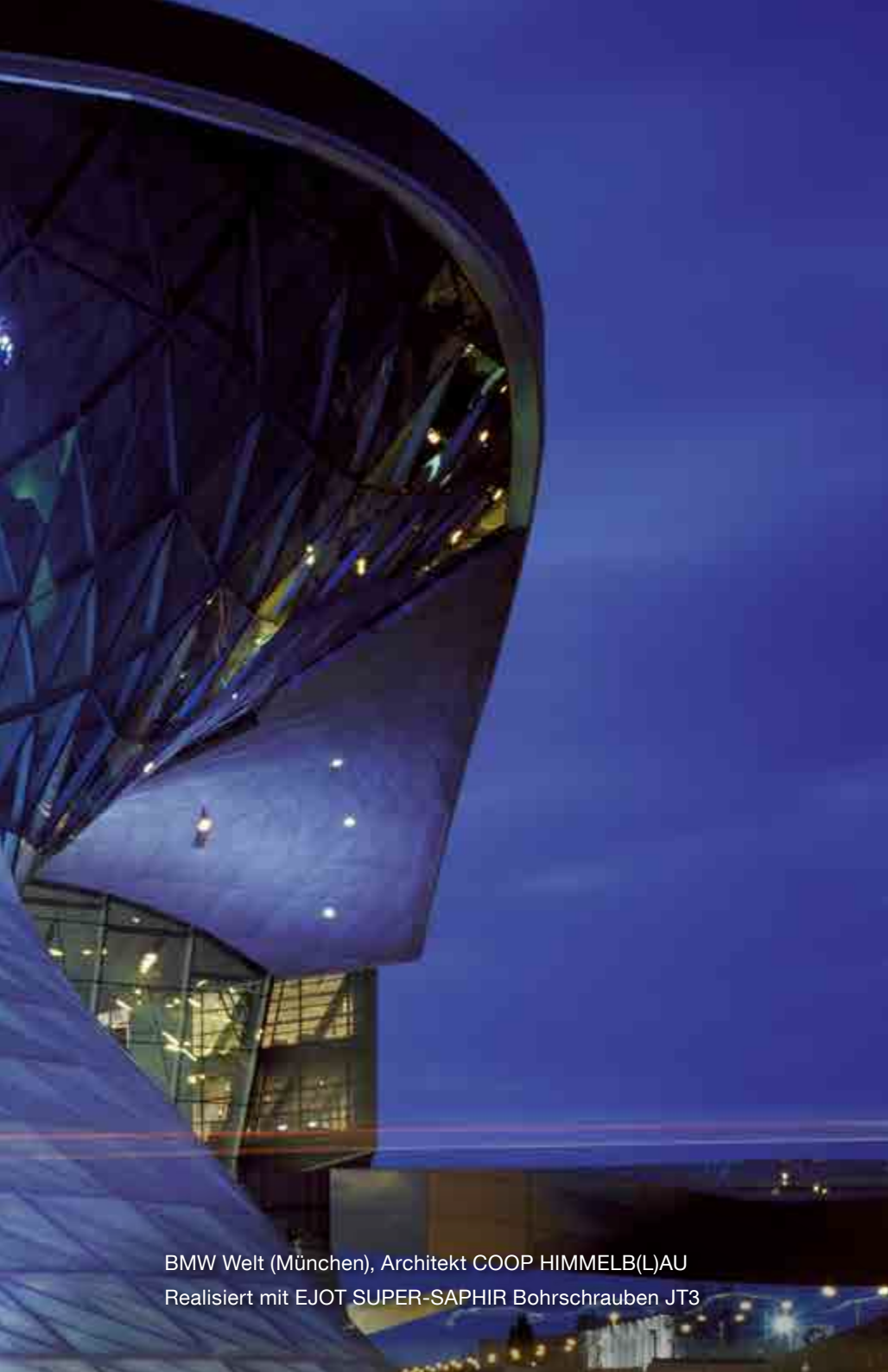
BMW Welt (München), Architekt COOP HIMMELB(L)AU Realisiert mit EJOT SUPER-SAPHIR Bohrschrauben JT3