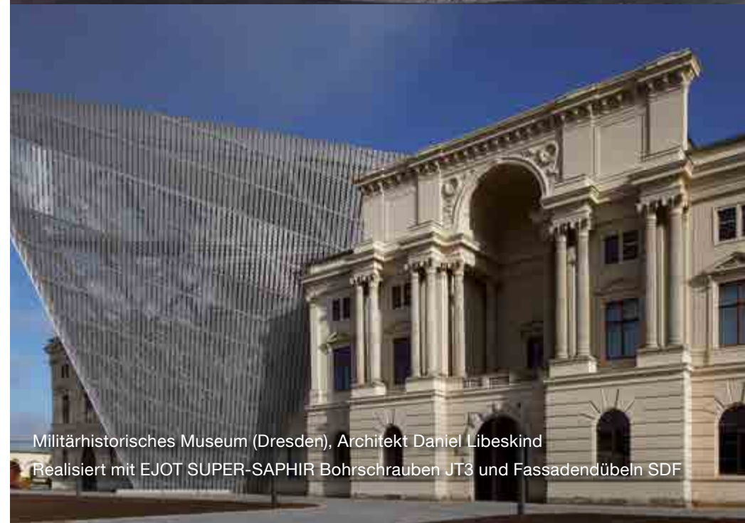
Militärhistorisches Museum (Dresden), Architekt Daniel Libeskind Realisiert mit EJOT SUPER-SAPHIR Bohrschrauben JT3 und Fassadendübeln SDF